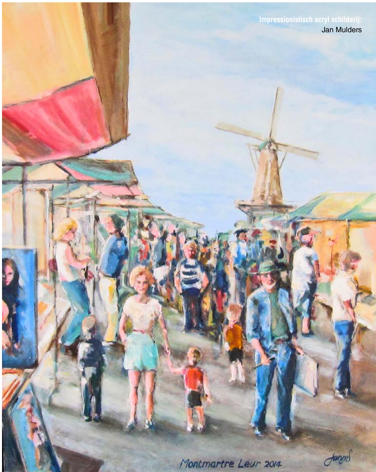
Impressionistisch acryl schilderij: Jan Mulders